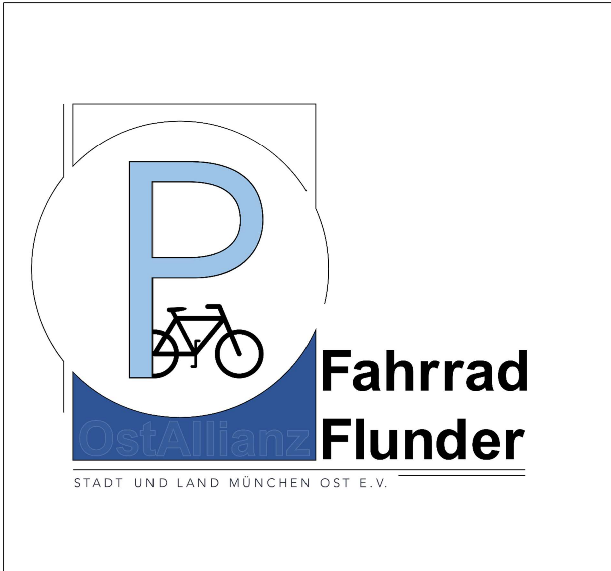
Logo der Fahrradflunder der OstAllianz.