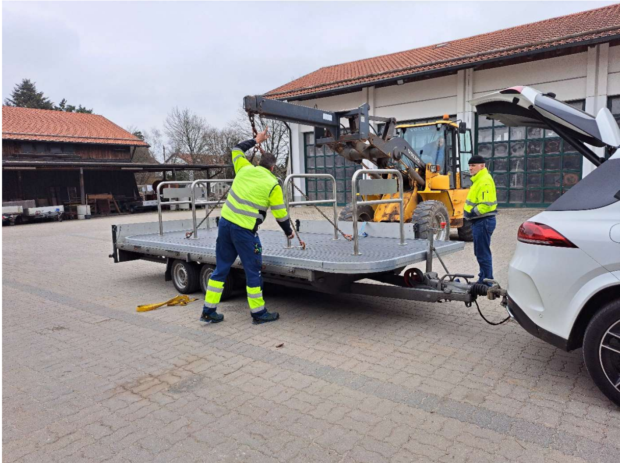
Mitarbeiter des Baubetriebshofes Vaterstetten beim Abladen der Fahrradflunder.