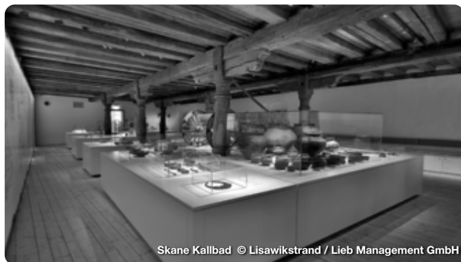
Skane Kallbad