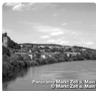
Panorama Markt Zell a. Main