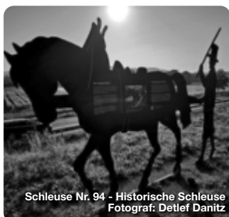
Schleuse Nr. 94 - Historische Schleuse