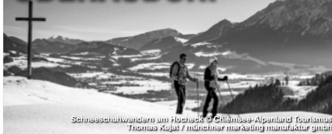
Schneeschnelwandler am Hocheck

Wenn die Wintersonne den Schnee glitzern lässt, als wären tausende von Diamanten verstreut. Wenn die weiße Pracht das Herz des Wintersportlers höherschlagen lässt und das atemberaubende Bergpanorama einem die Sprache verschlägt - dann beginnt er: der Winter im idyllischen Oberaudorf. Der kleine Luftkurort Oberaudorf im Voralpenland bietet jede Menge Wintererlebnisse fern ab von großen Touristenmassen. Zur Auswahl stehen bestens präparierte Pisten, kurvenreiche Rodelbahnen, aussichtsreiche Langlaufloipen sowie spannende Fackelwanderungen. Wellnessangebote, Gaumenfreuden und diverse Einkaufsmöglichkeiten machen Oberaudorf zu einem optimalen und einzigartigen Winter-Urlaubsort.