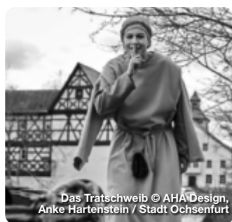
Das Tratschweib © AHA Design, Anke Hartenstein / Stadt Ochsenfurt