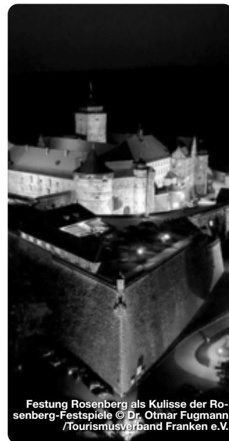
Festung Rosenberg als Kulisse der Rosenberg-Festspiele