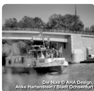
Die Nixe © AHA Design, Anke Hartenstein / Stadt Ochsenfurt