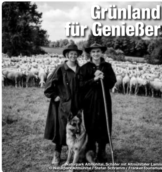
Naturpark Altmühltal, Schäfer mit Altmühltaler Lamm

Das Schöne an den fränkischen Naturparks ist, dass Landschaftsschutz hier sehr gut schmeckt! Viele Flächen, die wichtiger Lebensraum für Tiere und Pflanzen sind, können nur mit tierischer Hilfe erhalten werden. Deren Fleisch wiederum bereichert die regionale Küche. Vor allem Schafe spielen eine große Rolle, was Altmühltaler Lamm, Rhönschafe, Jura-Lamm, Frankenhöhe- oder Hesselberg-Lamm beweisen. Gesellschaft bekommen sie durch Beweidungs-Projekte wie das „Grünland Spessart“. Initiativen wie diese kommen nicht nur der Natur und den Genießern zu Gute: Auch für Landwirte und Schäfer bieten sich durch