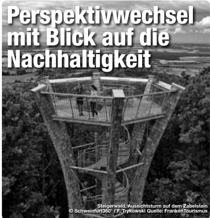
Steigerwald, Aussichtsturm auf dem Zabelstein

die Vermarktung neue Berufsperspektiven. Welche Dynamik solche Projekte entwickeln können, zeigt sich am Beispiel des Fichtelgebirgs-Dorfs Kleinwendern bei Bad Alexandersbad – Bayerns erstem „Arche-Dorf“. Dort startete vor zehn Jahren ein Rettungsprojekt für das vom Aussterben bedrohte „Sech-sämterrotvieh“. Das weckte bei der Dorfgemeinschaft die Begeisterung für viele weitere alte Nutztierassen. Produziert werden dort nun Eier von glücklichen Hühnern, Bio-Rindfleisch, Lammfleisch und Martinsgänse. Zudem bietet ein Bauernhof Alpaka-Wanderungen und Angebote für Gruppen an TreffpunktDeutschland.de/altmuehltal