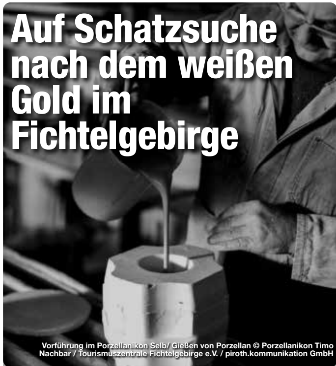
Vorführung im Porzellanikon Selb/ Gießen von Porzellan

In kaum einem anderen Ort im deutschsprachigen Raum ist die Porzellantradition so lebendig wie im nordbayerischen Fichtelgebirge, steht die Region doch seit Gründung der ersten Porzellanmanufaktur im Jahr 1814 für die europäische Porzellanherstellung wie keine zweite. Rund 80 Prozent des gesamten Gastronomie-Porzellans Deutschlands wird hier noch heute produziert. Während 20 bekannte Hersteller entlang der Porzellanstraße zu Werksverkäufen und Betriebsbesichtigungen einladen, gewährt Europas größtes Spezialmuseum für Porzellan, das Staatliche Museum für Porzellan in Selb und Hohenberg, seinen Besuchern spannende Einblicke in die 300-jährige Produktionsgeschichte.