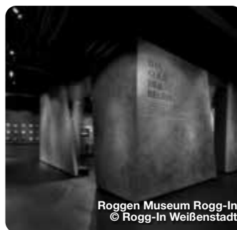
Roggen Museum Rogg-In