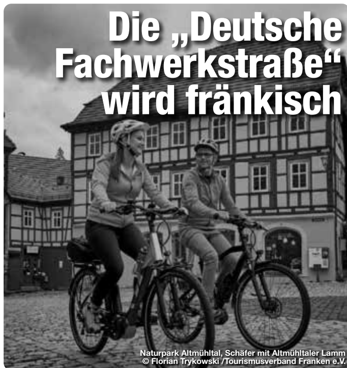
Naturpark Altmühltal, Schäfer mit Altmühltaler Lamm

Bereits seit 1990 besteht die Themenroute „Deutsche Fachwerkstraße“, die sich aus mehreren Teilstecken zusammensetzt. Nun wurde sie um die Regionalroute „Franken – Genuss mit Wein und Bier“ ergänzt. Auf der Landkarte bildet sie eine große „9“. Von Ochsenfurt im Fränkischen Weinland geht es über Marktbreit ins Romantische Franken nach Cadolzburg und von dort in den Steigerwald nach Herzogenaurach. Baunach bildet das Tor für den Abschnitt durch die Haßberge, dem im Obermain•Jura Fachwerkorte wie Marktzeuln oder in der Ferienregion Coburg.Rennsteig