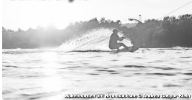
Wakeboarden am Brombachsee