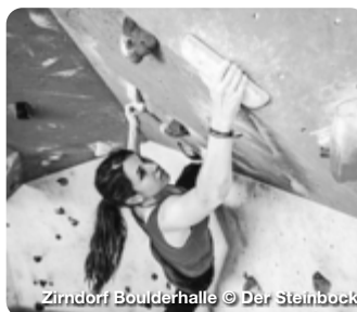
Zirndorf Boulderhalle

Naturlandschaft und Stadtfair – Landkreis Fürth entdecken. Im fränkische Landkreis Fürth, bei dem Städtedreieck Nürnberg, Fürth und Erlangen gelegen, gibt es viele Erlebnisse zu entdecken. Auf den zahlreichen Rad- und Wanderwegen durch das bezaubernde Bibertal oder den verträumten Zenngrund lässt sich der Landkreis entdecken. An Schlecht-Wetter können sich Besucher und Besucherinnen den Indoor Aktivitäten zuwenden. Genieß den Tag mit einem Spaziergang durch die historischen Räume des Faber-Castell Schlosses, mit Erholung in der Palm Beach Saunawelt oder mit einem Abend in den urigen Restaurants der Region. TreffpunktDeutschland.de/fuerth-landkreis