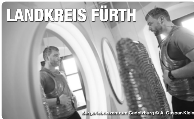
Bürgerlebenszentrum Cadolzburg

Naturlandschaft und Stadtfair – Landkreis Fürth entdecken. Im fränkische Landkreis Fürth, bei dem Städtedreieck Nürnberg, Fürth und Erlangen gelegen, gibt es viele Erlebnisse zu entdecken. Auf den zahlreichen Rad- und Wanderwegen durch das bezaubernde Bibertal oder den verträumten Zenngrund lässt sich der Landkreis entdecken. An Schlecht-Wetter können sich Besucher und Besucherinnen den Indoor Aktivitäten zuwenden. Genieß den Tag mit einem Spaziergang durch die historischen Räume des Faber-Castell Schlosses, mit Erholung in der Palm Beach Saunawelt oder mit einem Abend in den urigen Restaurants der Region. TreffpunktDeutschland.de/fuerth-landkreis