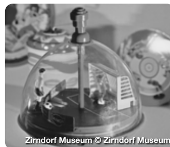
Zirndorf Museum