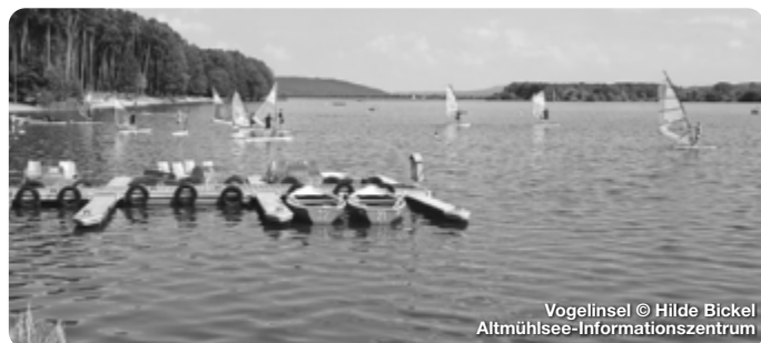
Vogelinsel