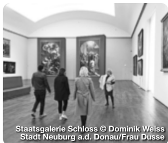
Staatsgalerie Schloss

TreffpunktDeutschland.de/neuburg-an-der-donau