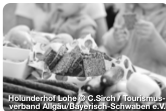
Holunderhof Lohr

TreffpunktDeutschland.de/bayerisch-schwaben