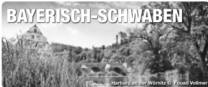
Harburg an der Wörnitz

Die Ausflugs- und Kurzurlaubsregion Bayerisch-Schwaben erstreckt sich vom Nördlinger Ries über das Schwäbische Donautal, die Fuggerstadt Augsburg und das LEGOLAND® bis ins Wittelsbacher Land. Radwege in idyllischen Flusslandschaften sowie Wander- und Themenwege durch die vielfältige Natur machen die Region zu einem beliebten Ziel für große und kleine Aktivurlauber. Zwischen prächtig-glanzvoll und verträumt-gemütlich präsentieren sich die Städte und Orte Bayerisch-Schwabens. Entlang der Romantischen Straße lassen sich viele Highlights verknüpfen. Kulturfans und Familien genießen das besondere Flair der historischen Stadtkulissen, Burgen und Straßenzüge, begeben sich auf die Spuren von Römern, Fuggern & Co.