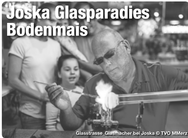
Glasstrasse_Glasmacher bei Joska

Hunderttausende Besucher jährlich zählen die 70.000 Quadratmeter großen Kristall-Erlebniswelten bei Joska in Bodenmais. Ausgebildete Glasbläser demonstrieren am Schmelzofen eindrucksvoll ihr Handwerk. Besucher können dort Glaskünstlern beim Schleifen, Gravieren oder Bemalen über die Schulter schauen und sich von der bunten und glitzernden Glaswelt verzaubern lassen. In den Kristallgärten holt man sich Deko-Ideen für den eigenen Garten: vom Schmetterling im Flug über Pfäue mit gläsernen Federn, Kugeln, die in allen möglichen Farben schillern, bis zu funkelnden Sonnen und