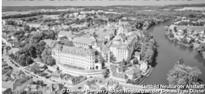
Luftbild Neuburger Altstadt

Höhepunkt des vollständig erhaltenen Altstadtensembles aus der Barock- und Renaissancezeit ist das weithin sichtbare Residenzschloss, das den ältesten evangelisch-lutherischen Sakralbau der Welt beherbergt und in der Staatsgalerie Flämische Barockmalerei wertvollste Exponate von europäischem Rang eindrucksvoll präsentiert. Neuburg an der Donau hat aber auch Aktivurlaubern viel zu bieten. Die Stadt liegt direkt am Donauradweg. Die attraktive Lage im Donautal an der Grenze zwischen Fränkischer Alb im Norden sowie Donaumoos und Hügelland im Süden macht Neuburg an der Donau auch zum idealen Ausgangspunkt für Wanderungen durch reizvolle Landschaften.!