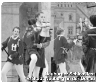
Neuburger Schloßfest © Stadt Neuburg an der Donau