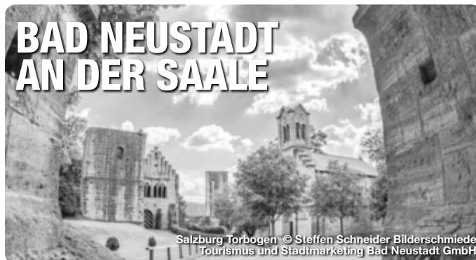
Salzburg Torbogen

Bad Neustadt a. d. Saale liegt in der Mitte Deutschlands, am Fuße der Bayerischen Rhön. Durch seine zentrale Lage ist der Ort gut zu erreichen und bietet viele Ausflugsmöglichkeiten in die vielseitige Region. Drei verschiedene, reizvolle Trails des DSV Nordic aktiv Walking Zentrums laden Walkingbegeisterte und Wanderer zum Entdecken ein. Die über 400 km markierten Wander- und Radwege auf teils stillgelegten Bahntrassen führen zu herrlichen Aussichtspunkten und beliebten Ausflugszielen in der Bayerischen Rhön. Das Wellness- und Erlebnisbad Triamare vereint Sport, Spaß und Wellness miteinander