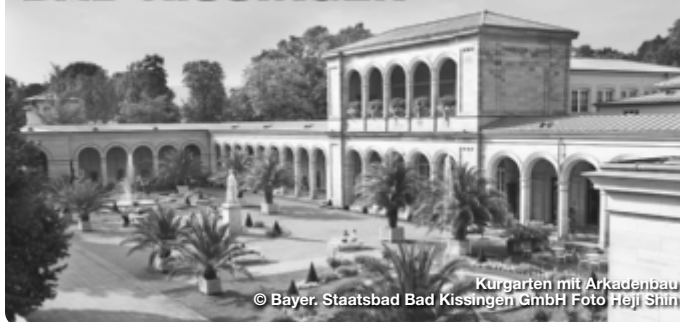
Kurgarten mit Arkadenbau

Im Herzen Deutschlands steht im Bayerischen Staatsbad Bad Kissingen der moderne Mensch mit seinem Bedürfnis nach Erholung und Entspannung im Mittelpunkt. „Zeit“ ist im bekanntesten Kurort Deutschlands zentrales Leitmotiv und überall zu spüren – in der eindrucksvollen Geschichte und Architektur, in den Gärten und Grünanlagen im Wechsel der Jahreszeiten, im ewigen Sprudeln der heilenden Quellen sowie den abwechslungsreichen Festen und Veranstaltungen. In Bad Kissingen verbindet sich altbewährte Bäderkultur mit Wellnessprogrammen auf höchstem Niveau, historische Ambiente trifft auf zeitgemäße Kultur- und Tourismusangebote.