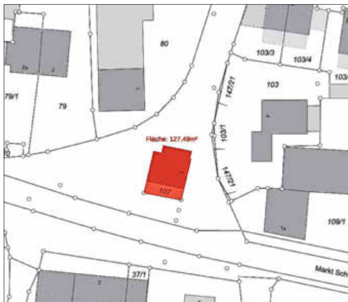
Abbildung 1 - Auszug Anlage 1 Geltungsbereich Fl.-Nr. 107