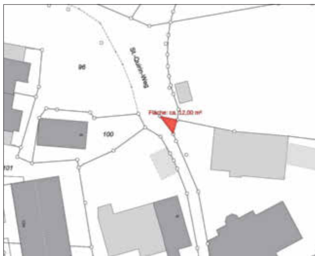
Abbildung 4 - Auszug Anlage 4 Geltungsbereich Fl.-Nr. 132