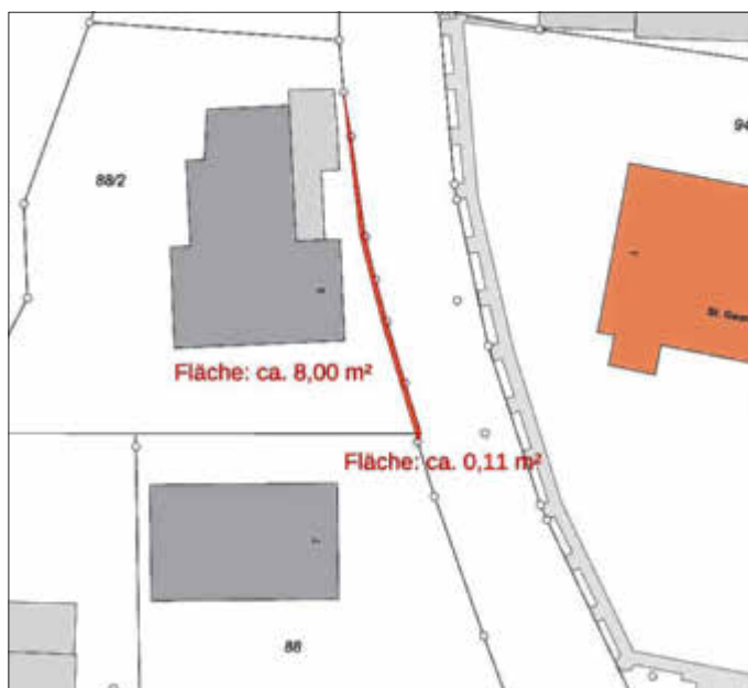
Abbildung 2 - Auszug Anlage 2 Geltungsbereich Fl.-Nrn. 88 u. 88/2